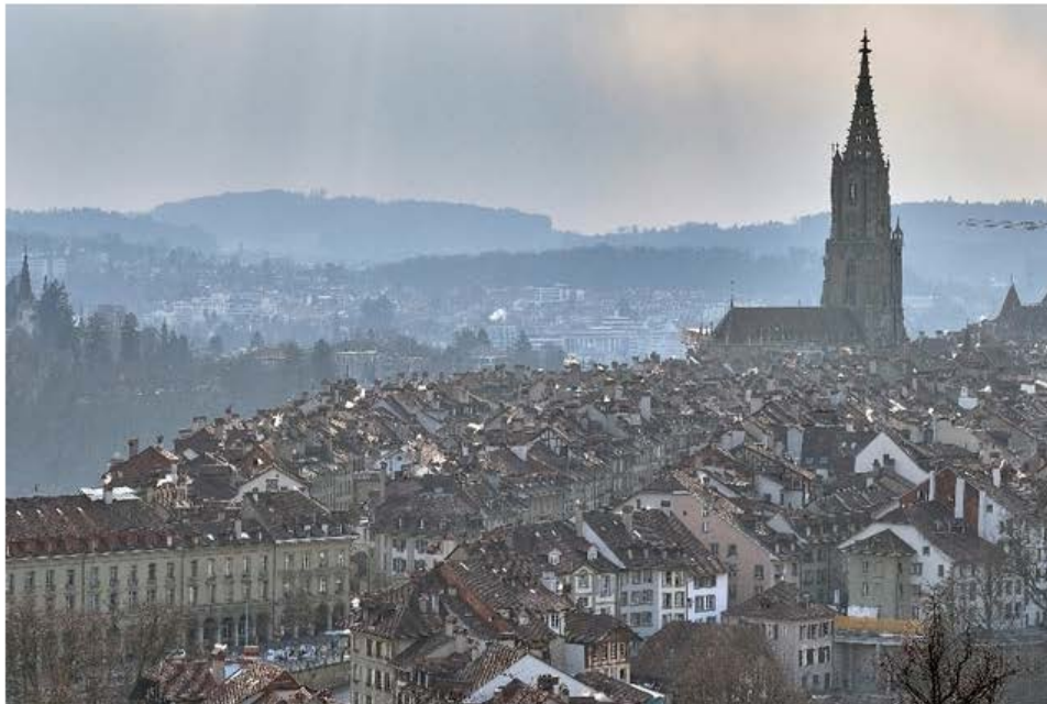
Bern, wie viel Digitalisierung soll es denn sein?

Stadt Bern Die einen mit Fokus auf die Chancen, die anderen eher mit Blick auf die Risiken: Das Thema Smart City beschäftigt auch die Politik.