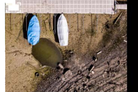
La sécheresse, et les bateaux de la région doivent rester à quai. (18 septembre 2018)