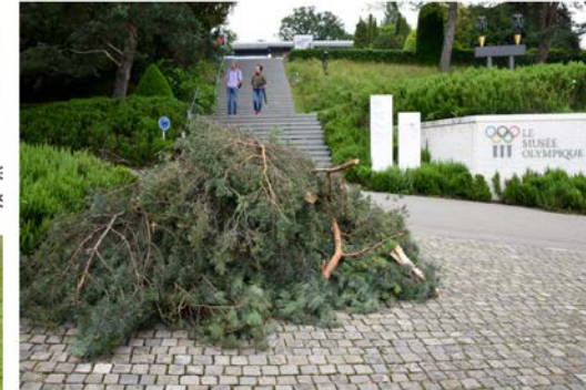
La tempête avait causé des dégâts importants sur l'ensemble du territoire lausannois. Le parc du Musée Olympique n'a pas été épargné. (28 Images)