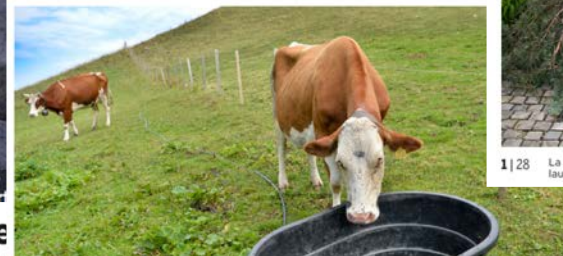
Suite à la sécheresse, les champs sont devenus inaccessibles. (9 Images)

Agriculture Comme en 2015, l'État ravitaille souvent par la route, parfois avec l'aide des hélicoptères.